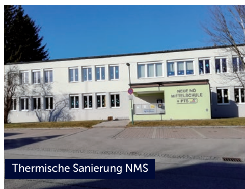
Thermische Sanierung NMS