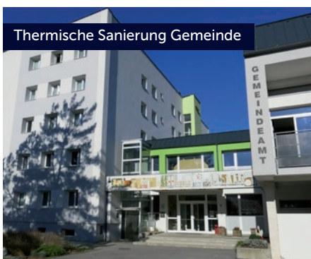
Thermische Sanierung Gemeinde