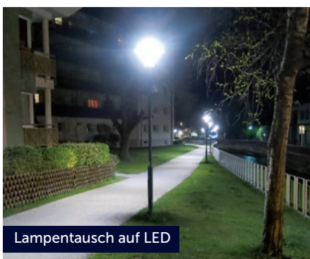
Lampentausch auf LED